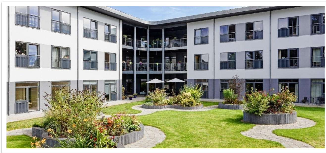
Plejecenter Digterparken, Grenaa

Ældreområdet har været skånet for større besparelser i 2025.