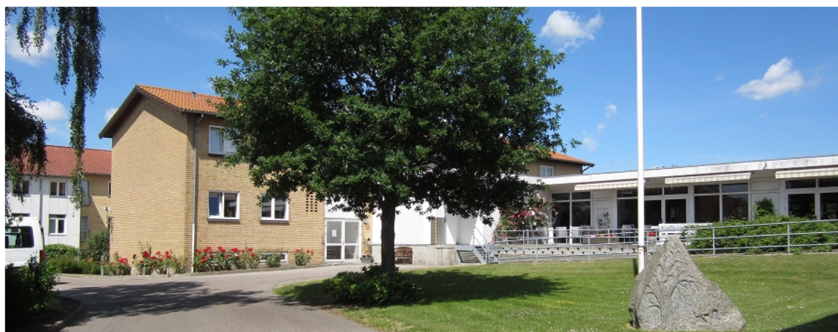
Plejecenter Farsøhthus, Allingåbro

Dette uddybes nærmere under fokusområder.