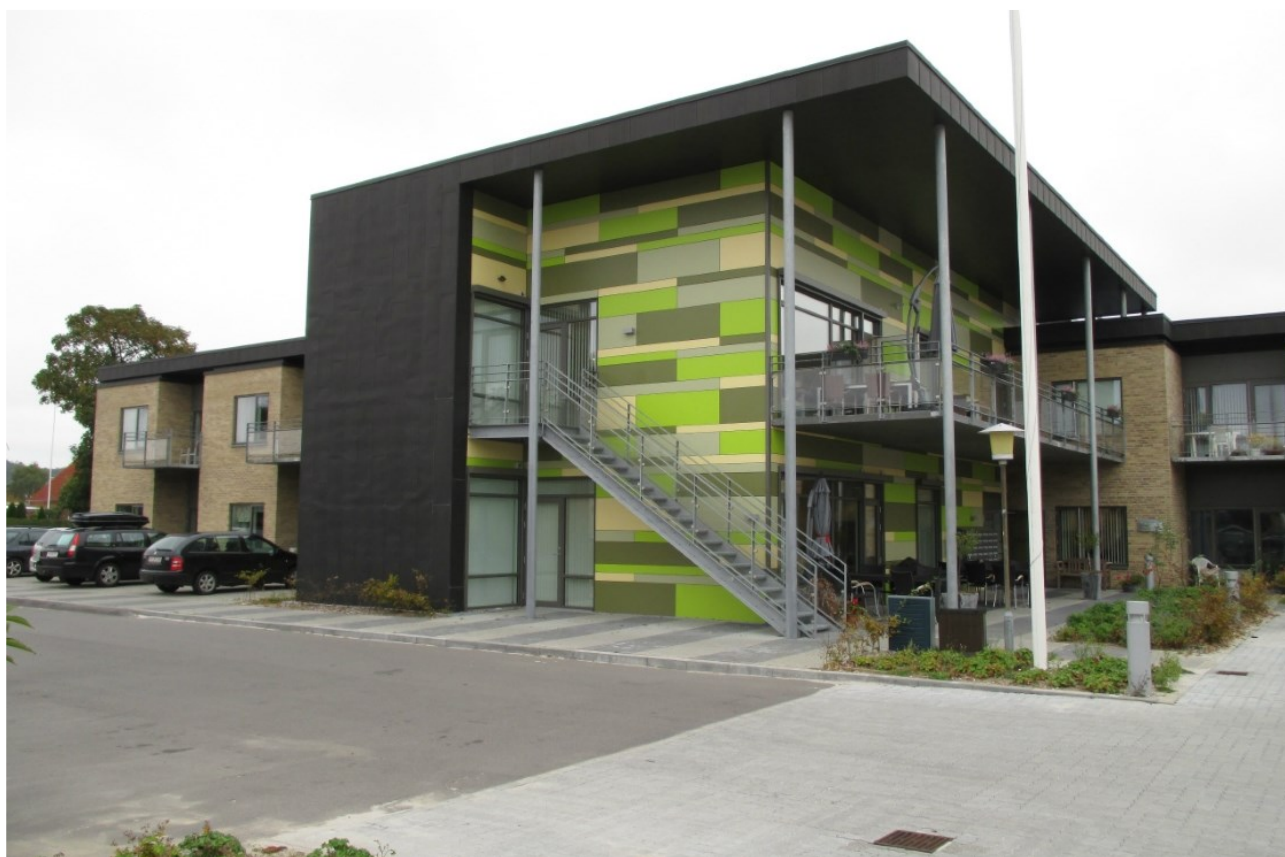
Plejecenter Møllehjemmet, Auning

Vi mener, at der er mange gode tiltag i Ældreloven bl.a. indførelse af små teams og at borgernes selvbestemmelse skal være en kerneværdi.