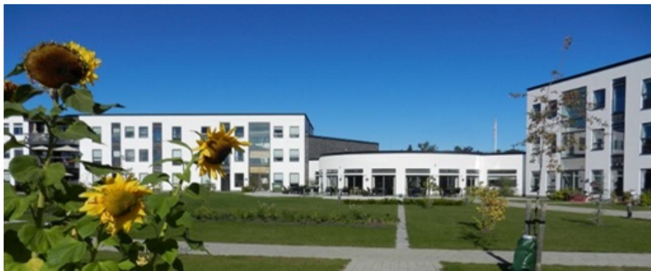
Plejecenter Violskrænten, Grenaa

Arbejdet med at etablere en overgang på A16 i den vestlige del af Auning er fortsat i gang. Mange ældre har svært ved at krydse hovedvejen, og dette har været et stort ønske. Vi samarbejder med Handicaprådet om dette.